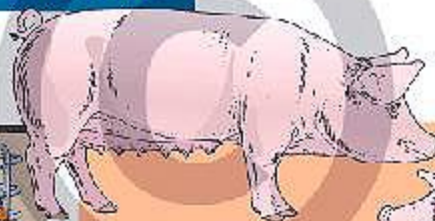
zeug van 177 tot 300 kg zwaar

Het varken is dan slachtrijp en kan naar het slachthuis worden vervoerd.